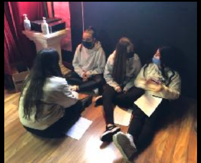
Artes Escénicas 4º ESO / IES Bezmiliana