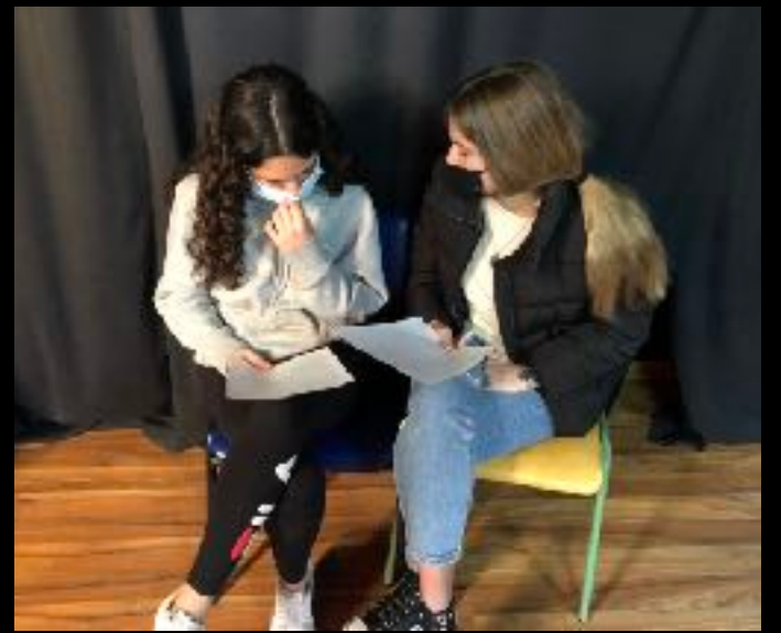
Artes Escénicas 4º ESO / IES Bezmiliana